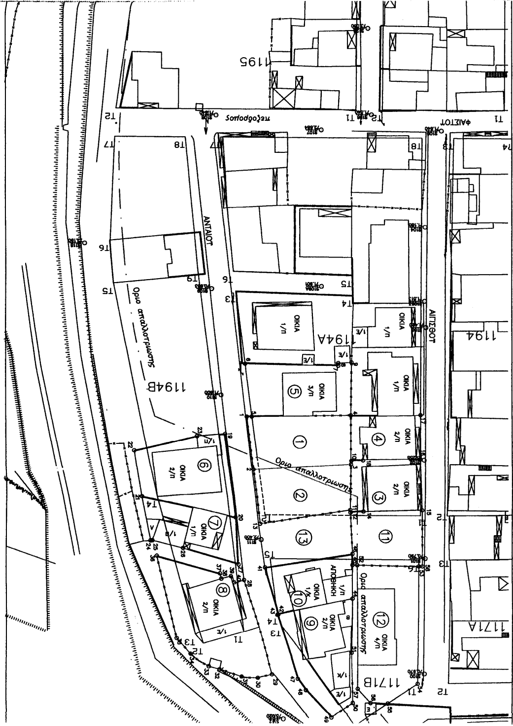
ΤΟΠΟΓΡΑΦΙΚΟ ΔΙΑΓΡΑΜΜΑ ΕΦΑΡΜΟΓΗΣ ΚΙΛΙΜΑΚΑ 1:500