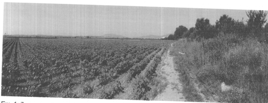
Εικ. 1: Άποψη της περιοχής του έργου

Στην περιοχή έχει γίνει αναδιασμός το 1971, σύμφωνα με τον οποίο έχουν προβλεφθεί δρόμοι για την εξυπηρέτηση των αγροτεμαχίων, ενώ κάποιες εκτάσεις ανήκουν στη νυν Δ.Κ. Τερψιθέας.