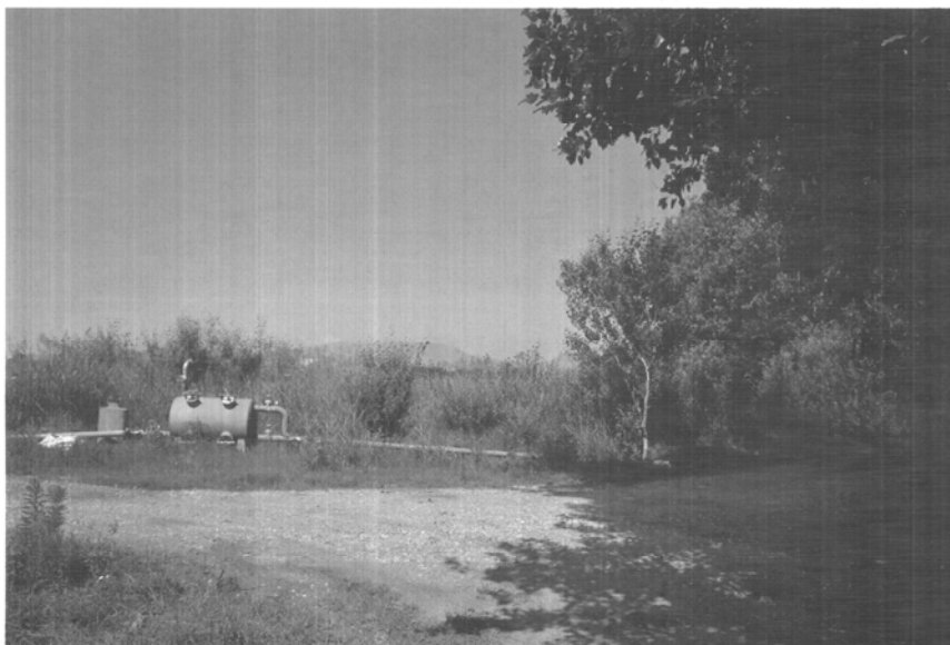
Εικ. 5: Το τέλος του δρόμου πρόσβασης και η περιοχή που θα διαμορφωθεί ως χώρος στάθμευσης

Λόγω της απόστασης του έργου από τη Λάρισα και τις γύρω περιοχές (Τερπιθέα, Γιάννουλη,...) προβλέπεται η κατασκευή χώρου στάθμευσης αυτοκινήτων και λεωφορείων, διευκολύνοντας την πρόσβαση και την επίσκεψη. Ο χώρος αυτός θα δημιουργηθεί στο τέλος του δρόμου πρόσβασης, σε έκταση που ανήκει στη Δ.Κ. Τερπιθέας και καλύπτει μια επιφάνεια περίπου 4.700 τ.μ. (εικ. 5).