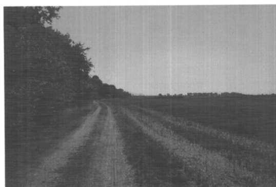
Εικ. 3: Η αντιθετική συνύπαρξη καλλιεργούμενων εκτάσεων και βλάστησης της κοίτης

Ιδιαίτερη επισήμανση θα πρέπει να γίνει στη σχέση του χρήστη/επισκέπτη με το ποτάμι. Ο χαρακτήρας της βλάστησης της κοίτης που λειτουργεί ως «φράγμα» (ειδικά τους καλοκαιρινούς μήνες), σε συνδυασμό με τις πολύ έντονες κλίσεις των πρανών, αφαιρούν τη δυνατότητα άμεσης επαφής με το υδάτινο στοιχείο και πρόσβασης σε αυτό. Αν, όμως, η εν λόγω διαμόρφωση θεωρηθεί ως τμήμα μιας ευρύτερης επέμβασης, η οποία θα δημιουργεί μια εκτεταμένη παραπήνεια διαδρομή, τότε η συγκεκριμένη αδυναμία επαφής είναι απλώς ένα μεμονωμένο χαρακτηριστικό μιας πλούσιας σε εναλλαγές παραποτάμιας κίνησης. Μιας κίνησης που θα προσεγγίζει ή θα απομακρύνεται από το νερό προσφέροντας ανάλογα ποικιλία στην περιήγηση και δυνατότητες διαφορετικών χρήσεων (εικ. 4).