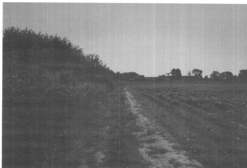
Εικ. 6: Η περιοχή που θα διαμορφωθεί ως άξονας μετακίνησης - διάδρομος

Κάθετα στον άξονα της κίνησης δημιουργούνται μικρότερα ή μεγαλύτερα πλατώματα, τα οποία υποδέχονται τους αναγκαίους χώρους στάσης και εξοπλίζονται με καθιστικά.