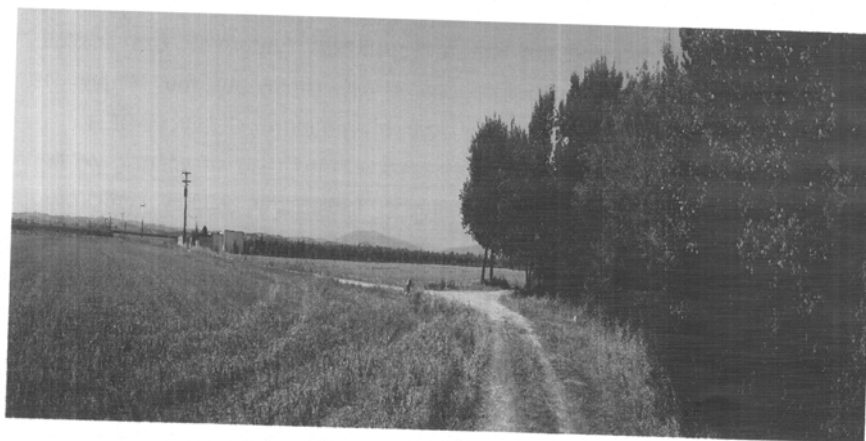
Εικ. 2: Άποψη του κυρίαρχου αγροτικού τοπίου

Στη σημερινή της κατάσταση η περιοχή εμφανίζει ως κυρίαρχη την αγροτική χρήση. Η ανάπτυξη δραστηριοτήτων που να σχετίζονται με την αναψυχή και τον αθλητισμό δεν ευνοείται, καθώς απουσιάζουν οι υποδομές και οι κατασκευές που θα τις υποστήριζαν (εικ. 2).