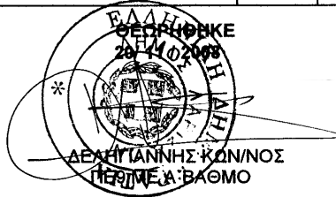
ΜΑΝΟΥΣΙΟΣ ΧΡΗΣΤΟΣ ΠΕ ΠΕΡΙΒΑΛΛΟΝΤΟΛΟΓΩΝ